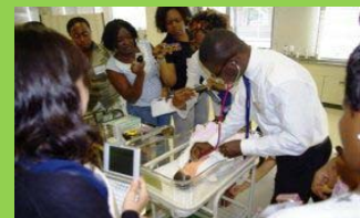
Curso de Gestão em Saúde Materna e Infantil

Total de 204 mil trabalhadores da área de saúde e Medicina treinados (em março de 2012)