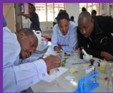
Professores em curso de treinamento

Total de 388 mil Professores de matemática e ciência do primário e secundário treinados (no primeiro semestre de 2011)