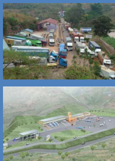
Acima: Atual OSBP Abaixo: Depois de concluída

3,5 US$ bilhões em apoio em matéria de transportes, energia, água e TIC, incluindo 14 locais de "Postos de Fronteira de Uma Parada" (OSBPs)