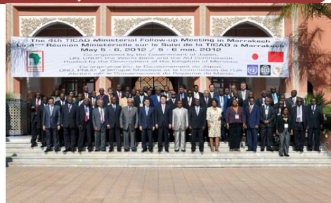
Sessão de fotos na Reunião de acompanhamento Ministerial da TICAD em Marrocos, em maio de 2012.

TICAD é uma reunião de cúpula sobre o desenvolvimento africano iniciado pelo Japão em 1993 e co-organizada pelo Japão, a Comissão da União Africana (CUA), a Nações Unidas, o Banco Mundial e o PNUD, que se abre para organizações internacionais e regionais, OSCs, o setor privado, e parceiros de desenvolvimento. A TICAD é baseada em “ownership” da África e conta com “partnership” da comunidade internacional.