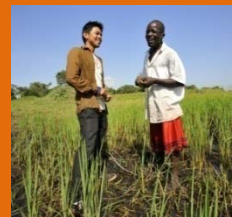
Fazendeiro com um JOCV em uma plantação de arroz

Produção de 18,4 milhões de toneladas de arroz estocados (em 2010) e, até 2018, produção projetada de até 27 milhões de toneladas de arroz sob o CARD