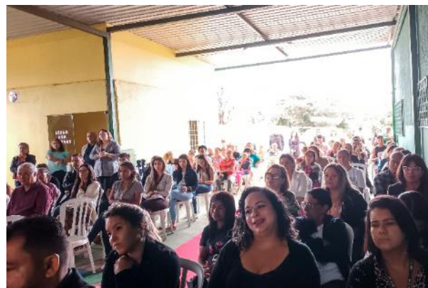
集まった保護者・地域住民の皆様