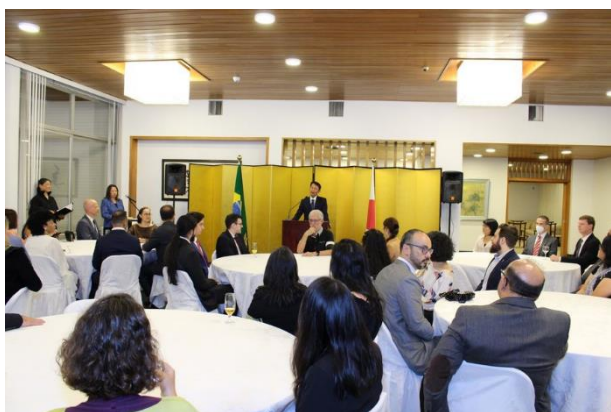
レセプションの様子

3月2日、林大使は公邸において2023年国費留学生壮行レセプションを開催。レセプションには、新たな国費留学生に加え、ブラジル元国費留学生同窓会（ABRAEX）幹部、元国費留学生、ブラジル大学日本語コースおよびブラジル日本語モデル校の日本語教師が参加。林大使は、国費留学生にお祝いの言葉を述べるとともに、国費留学生が日本の名門大学で学ぶ機会を得て、両国の関係をさらに強固なものにしてほしいとの思いを強調した。