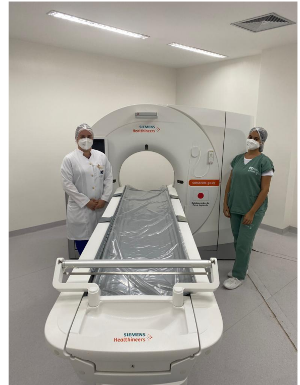
Tomógrafo instalado no Hospital Metropolitano, Maceió-Alagoas