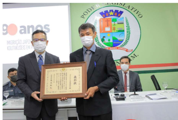
パリンチンス日伯協会への外務大臣表彰の授与