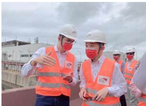
リオ州アスー港視察

さらに、カンポス・ドス・ゴイタカゼス市に所在する州立ノルチ・フルミネンセ大学及び私立カンジド・メンデス大学を訪問し、学長や教授陣との意見交換及び各研究所を視察したほか、メリダ同市経済開発・観光長官との懇談を実施した。