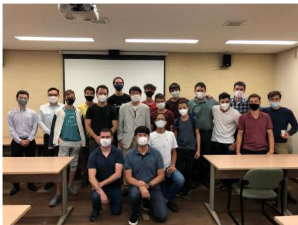
イベント参加者との記念撮影