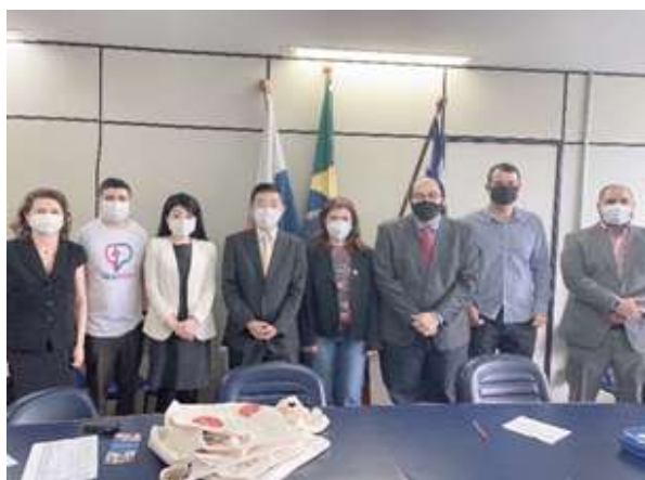
州立ノルチ・フルミネンセ大学訪問