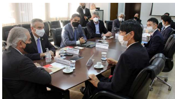
アザンブージャ州知事表敬