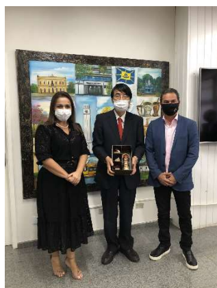
トラッジ市長表敬