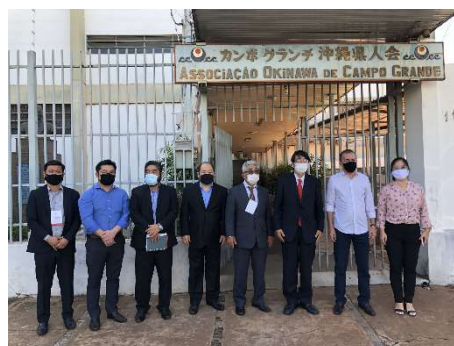
カンポ・グランデ沖縄県人会視察