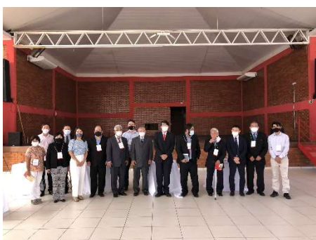
カンポ・グランデ日伯体育文化協会訪問

その他、カンポ・グランデ日伯体育文化協会等を訪問、移民先駆者慰霊碑への献花及び秋篠宮同妃両殿下ご訪問記念碑を視察し、同協会代表者をはじめ、同州各地から参集した各日系団体の代表者との意見交換を実施。またカンポ・グランデ市観光局による案内のもと、市内をバスで周回し、ハジオ・クルービ広場に設置された五重塔を模ったモニュメント及び日本人移民70周年記念碑を視察。