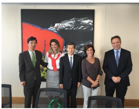
マリア・シルビアBNDES総裁との会談 (左から、星野公使、セリーナ・カンペロ総裁補佐官、佐藤大使、マリア・シルビア総裁、レオナルド・フェレイラ国際関係局長)