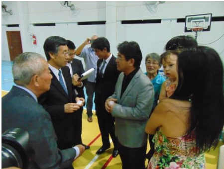
日系団体との懇談