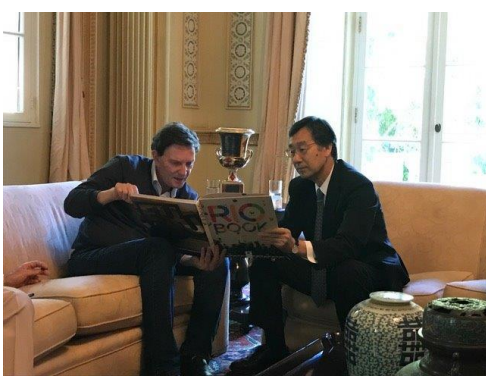
マルセロ・ベゼーハ・クリヴェーラ リオデジャネイロ市長との会談