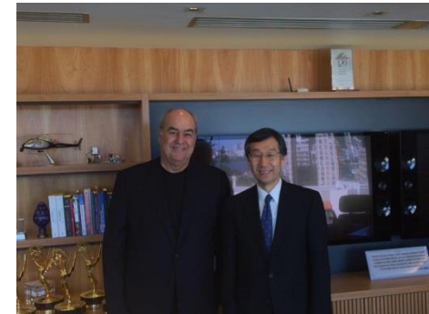
ホベルト・イリネウ・マリーニョ グローボ・グループ会長